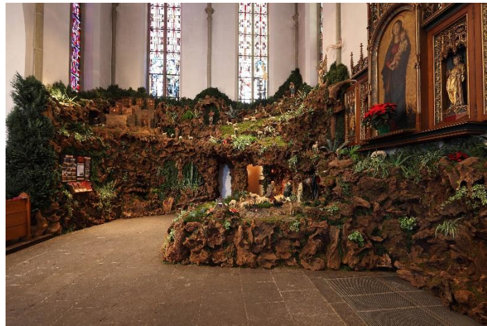
Weihnachtskrippe in 56598 Rheinbrohl

frohe Weihnachten und einen guten Start ins neue Jahr 2025 wünschen.