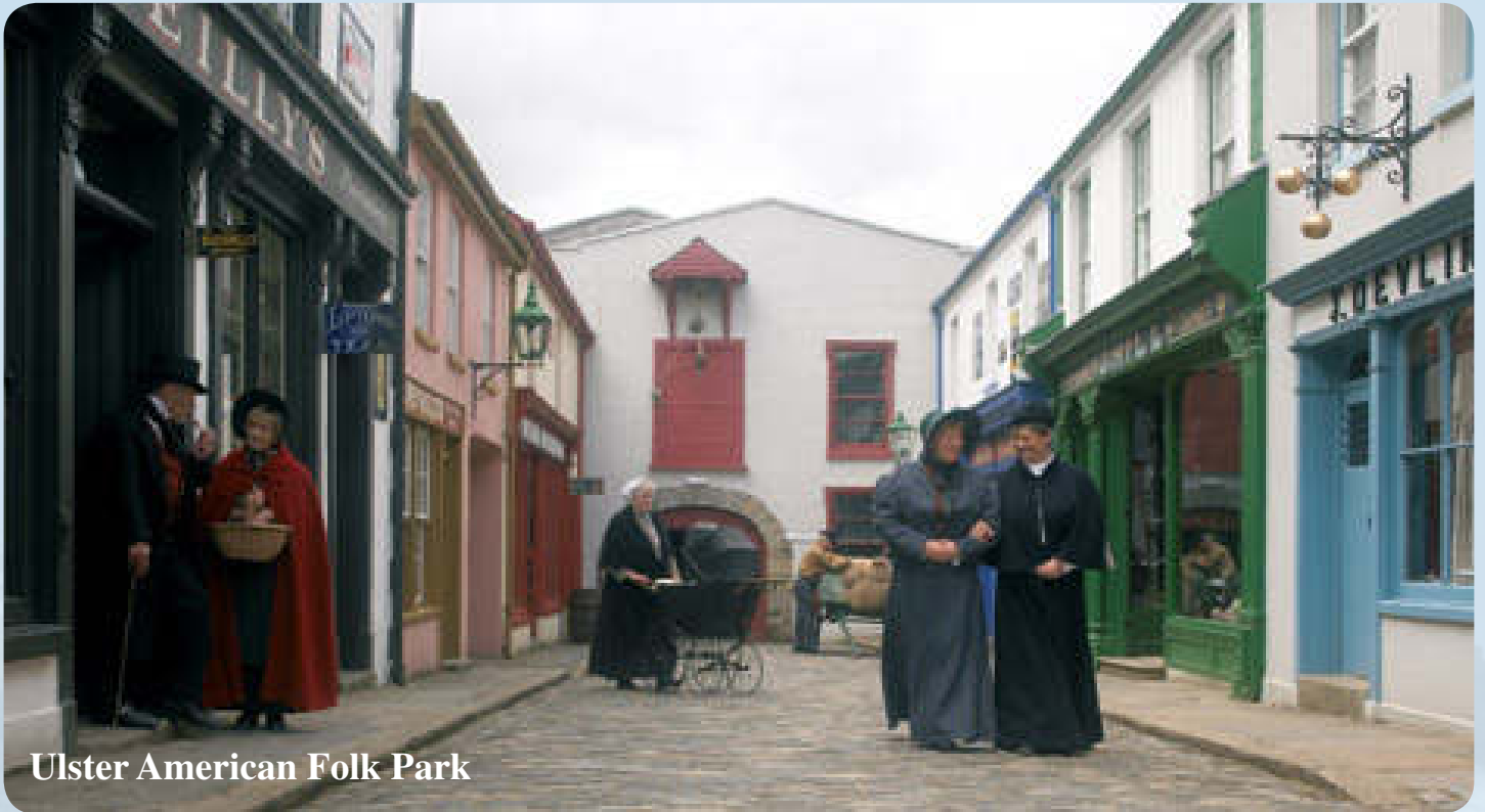
Ulster American Folk Park

Park, der sich mit der Geschichte der Auswanderung der Menschen aus der nördlichen Provinz Ulster nach Amerika befasst. 2 Übernachtungen in/bei Dublin.