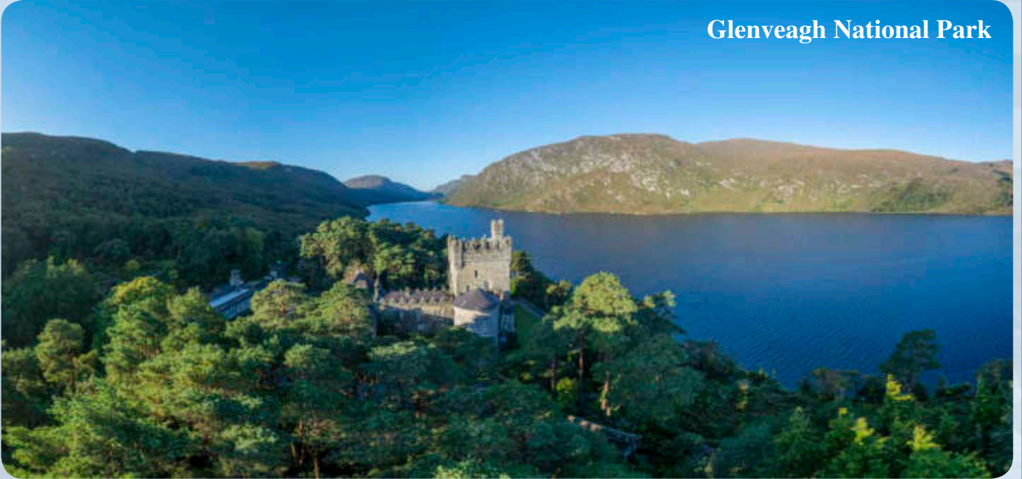
Glenveagh National Park

Der heutige Vormittag gehört dem Glenveagh National Park, mitten in der Berglandschaft Donegals gelegen. Wir werden diese wunderschöne Region auf etwas ungewöhnliche Art erschließen: Vom Geburtsort des Heiligen Columba d.Ä. wandern wir in gut 1 ½ Stunden ins Herz des Nationalparks, zum Jagdschloss von Glenveagh, direkt am See gelegen, wunderbar in die Berglandschaft eingebettet, und umgeben von Parkanlagen und einem „Walled Garden“. Nachmittags dann Fahrt zum an einem Meeresarm gelegenen Kapuzzinerklosters Ards Friary und Erkundung von dessen wunderbarer Umgebung – Sandstrände und Waldgebiete.