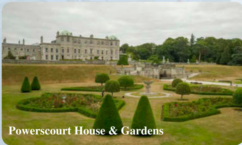
Powerscourt House & Gardens

In Dublin wird es Zeit für eine Ihnen wichtige abschließende optionale Besichtigung geben. Vielleicht aber wollen Sie sich heute auch einfach Zeit zum individuellen Erkunden von Irlands lebendiger Hauptstadt nehmen, zum Last Shopping ... – Am Nachmittag Transfer zum Flughafen und Rückflug nach Frankfurt.